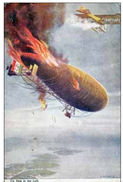
Benedek Elek lapjának képes oldala