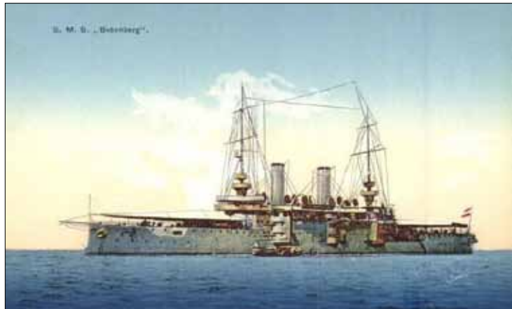
Az SMS Babenberg korabeli képeslapon

A közelmúltban ritka, mezőtúri címre küldött képeslapot sikerült megszerezni a Helytörténeti Gyűjteménytár számára. Legfőbb értékét a feladó tengerészbeosztása a Monarchia egyik legnagyobb csatahajóján (SMS Babenberg) 15 és a mezőtúri címzés együttesen adja. Ez annyira ritka kombináció, hogy eddig még ilyet soha nem láttunk. Olyan mezőtúri vagy közvetve ideköthető személy, aki az első világháborúban a haditengerészetnél szolgált, mindeddig nem került a látóterünkbe. (Ugyanez a helyzet a légierővel is: név szerint egyetlen mezőtúrit sem ismerünk, aki pilóta lett volna a háborúban.) Azok a mezőtúriak, akiknek tudjuk a nevét, mind szárazföldi fegyvernemeknél szolgáltak, a gyalogságnál, lovasságnál, tüzérségnél, műszakiaknál és hasonlóknál, éppen ezért meglehetősen szokatlan gondolat, hogy a haditengerészetnél egy is előfordult közülük. Magyarország a kontinentális országok tengerrel egyáltalán nem rendelkező csoportjába tartozik, történelmünkben nincsenek jelentős tengeri csaták, a tengerésztörténeteket külföldi regényekből ismerjük, kultúránknak és identitásunknak egyáltalán nem része a tenger és tartozékai. Egy alföldi parasztfiút vagy iparosinast, de még egy tanultabb embert – mint amilyen ennek a képeslapnak az írója – sem hétköznapi elképzelni matrózként.