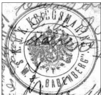
A hajó címeres bélyegzője egy másik levelezőlapon