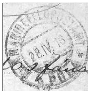
A postai bélyegző (felirata: K. u. K. Marinefeldpostamt, Pola 28. IV. 16)