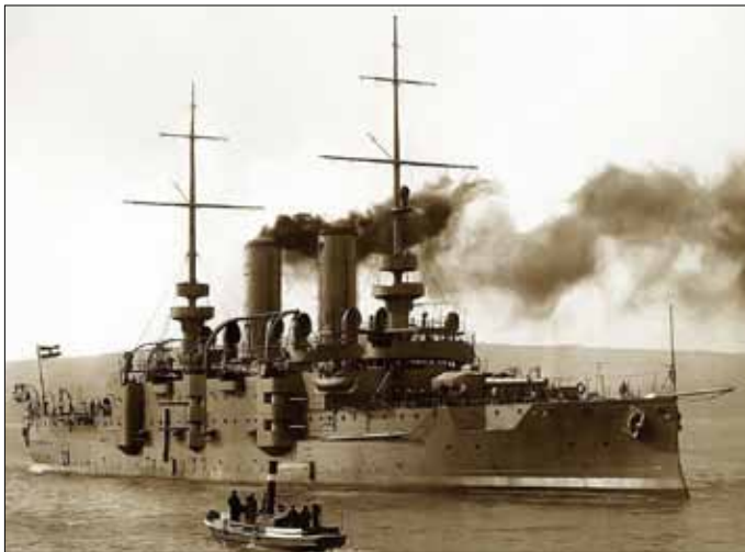
Az SMS Babenberg fényképen

A dreadnought típus névadója a brit Királyi Haditengerészet 1906-ban szolgálatba lépett forradalmian új csatahajója, a HMS Dreadnought ( Rettenthetetlen ) volt. A századelő legkorszerűbb és egyben a világ első csatahajója rögtön elavulttá tette az összes akkori páncélos sorhajót, melyek közül a legkorszerűbbek is csak 4 darab 305 mm nehézlőveggel rendelkeztek, és gőzgépmeghajtásúak voltak, míg a Dreadnought 10 darab 305 mm ágyúval lett felszerelve, és gőzturbinák hajtották. Ennek a hajónak a mintájára épültek 1906 után más országokban is a róla elnevezett dreadnought -ok, és ezekből a Monarchia 4 darabbal rendelkezett a Tegetthoff -osztályban: SMS Viribus Unitis (a flotta zászlóshajója), SMS Tegetthoff , SMS Prinz Eugen , SMS Szent István .