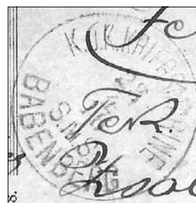
A hajó dátumos bélyegzője (felirata: K. u. K. Kriegsmarine S.M.S. Babenberg 28-4-16)